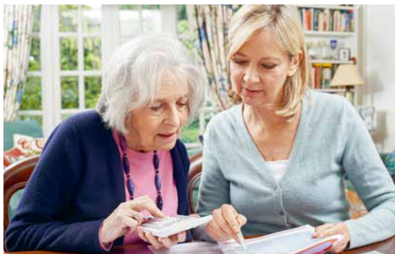
Mit der höheren Lebenserwartung sind die Anforderungen bezüglich der Betreuung und Pflege betagter Menschen stark angestiegen.

Die grösstenteils von Frauen geleistete und meist unbezahlte Sorgearbeit gerät immer mehr unter Druck. Nur eine Aufwertung und Neuverteilung innerhalb der Gesellschaft kann hier Abhilfe schaffen.