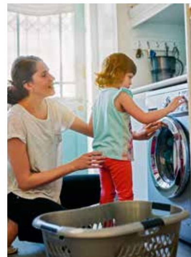
Sorge- und Haushaltsarbeit werden mehrheitlich von Frauen bestritten.

Nur gerade 10 Prozent der gesamten Sorgearbeit in der Schweiz fällt auf den bezahlten Care-Sektor, zu dem etwa Kindertagesstätten, Pflege- und Altersheime gehören. Und doch ist vor allem dieser Teil Ursache für heftige Auseinandersetzungen in Gesellschaft und Politik. Die aktuelle Debatte wird durch Begriffe wie «Kostenexplosion» und durch Sparmassnahmen im Sozial- und Gesundheitswesen geprägt. Laut aktuellen Prognosen müssen alleine in der Schweiz in den kommenden Jahren 120 000 neue Stellen im Pflege- und Be-