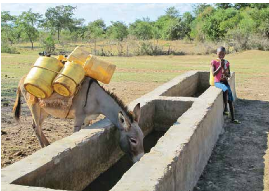
Wassermangel ist in Kenia ein Problem: Lokal angepasste Sorten können damit umgehen.