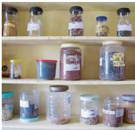
Mit einer Saatgutbank versuchen lokale Netzwerke, einheimische Saatgutsorten zu bewahren.