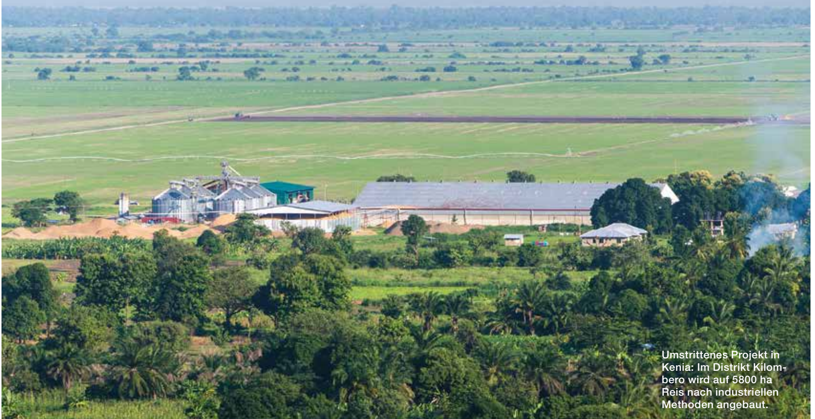
Umstrittenes Projekt in Kenia: Im Distrikt Kilombero wird auf 5800 ha Reis nach industriellen Methoden angebaut.