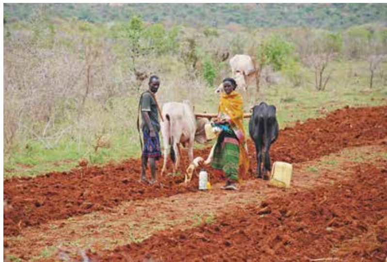
Arbeitsintensive Landwirtschaft: Eine Kleinbauernfamilie in Äthiopien bewirtschaftet ihre Felder mit Hilfe eines Ochsen-Gespans.

Die Forderung der Kleinbauernvereinigungen und Entwicklungsorganisationen wie Brot für alle und Fastenopfer ist deshalb klar: Es braucht demokratische Investitionen, die nicht eine desaströse industrielle Landwirtschaft fördern, sondern zukunftsweisende Alternativen. Der Schlüssel liegt in der Stärkung einer kleinbäuerlichen