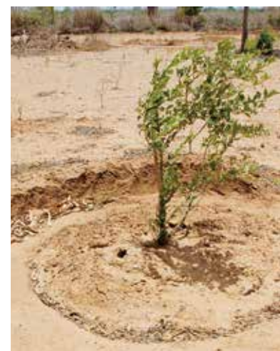
Arbeiten mit lokalen Ressourcen: Um das Regenwasser besser zu nutzen, ziehen die Kleinbauern Ringgraben um die Jungpflanzen.

Landwirtschaft, die den natürlichen Kreisläufen Sorge trägt, wie es bereits der Weltagrarbericht 2008 deutlich sagt. Denn während die Agrarkonzerne Rohstoffe für die Viehmast, die Industrie und Treibstoffe anbauen, sind es nach wie vor die Kleinbäuerinnen und -bauern, die rund 70 Prozent unserer Nahrungsmittel produzieren.