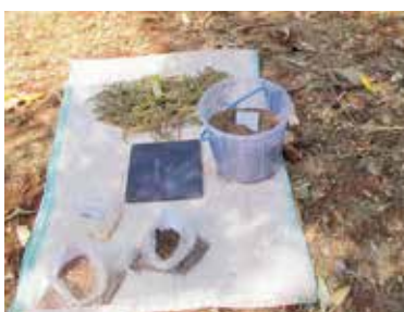
Der Verkauf von selbst hergestelltem Saatgut ist in Kenia nach neuestem Gesetz ein krimineller Akt.