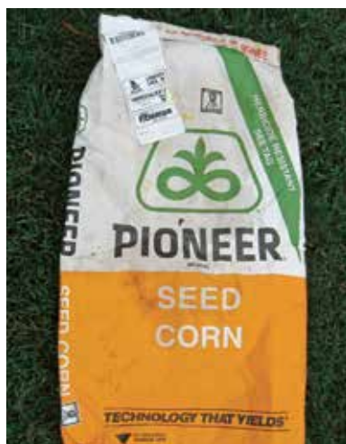
Bereits das Saatgut der Agrokonzerne ist auf den Gifteinsatz ausgerichtet: Herbizidresistenter Mais des US-Konzerns DuPont.